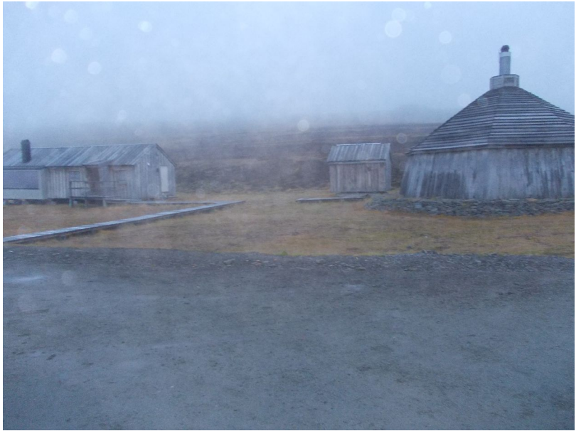
Lavvoen som var en utmerket restaurant

Om kvelden hadde vi utflukt til Camp Barentz. Da kjørte bussen forbi kennelen og vannreservoaret og videre til vi så en bevæpnet mann på veien. Han var franskmann, men snakket norsk. Bak ham lå en lavvo bygget av trematerialer. (Bildet av lavvoen er dårlig fordi det regnet på linsen, men det er det eneste jeg har, og jeg synes bebyggelsen Camp Barentz var såpass original at jeg må vise det likevel.)