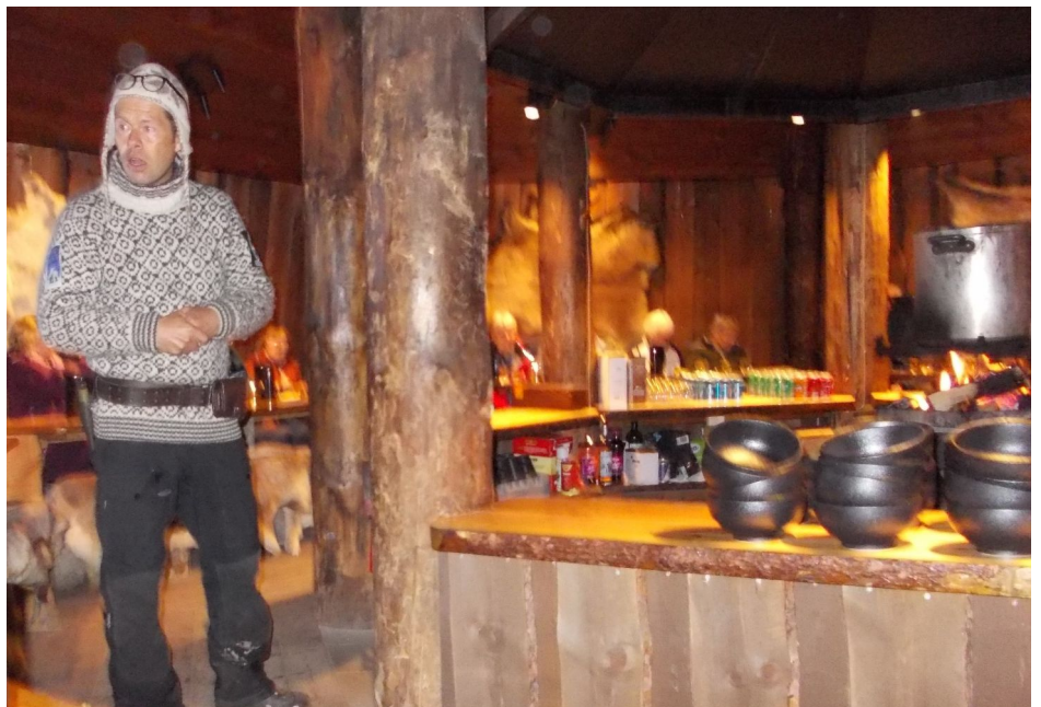
Vakta som foredragsholder og servitør

Inne i lavvoen hilste vi på enda en mann og en dame. De drev og lagde mat i ei gryte som hang over flammen midt i rommet. Langs ytterveggene sto det benker som vi ble bedt om å sette oss på. Så fulgte en kort orientering om at vi ville få servert maten, så vi skulle bare sitte stille. Vi ville også få bragt drikke når vi ba om det. Det var bare å velge mellom akevitt, øl og vin (og det var visst enda mer å velge i). Etter at vi hadde kommet i gang med spisingen, fortalte franskmannen litt humoristisk