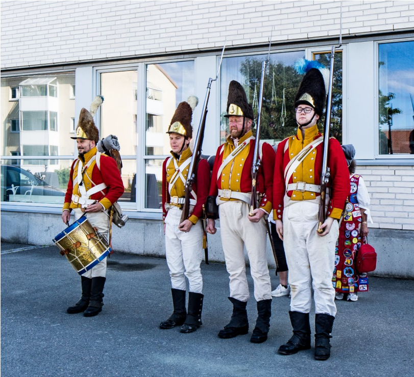
Nordenfjeldske Grenader Compagnie klar til avmarsj.

trommer. Publikum fulgte etter som en hale, fram til festning – hvor salutteringen fant sted. Spennende for store og små!