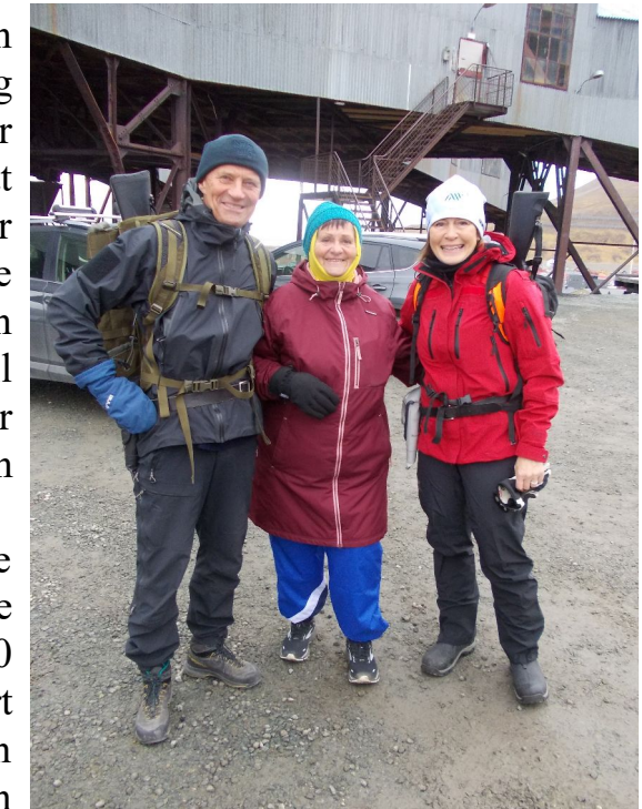
Lederen sammen med de væpnede vaktene

Om kvelden gikk vi over den smale broen igjen, tok til høyre og kom til en restaurant som kalles Vinterhaven. Der hadde "sunnmøringen" vært og bestilt bord for hele turmarsjgjengen. Da vi satte oss ved langbordet, fikk vi en meny. Jeg ønsket å spise selkjøtt, men ble fortalt av servitøren at vi ikke kunne bestille noe av det som sto der, for hun som hadde bestilt bord for oss, hadde bestemt at alle skulle spise rensdyrstek. Begrunnelsen var at da ville det bli enklere