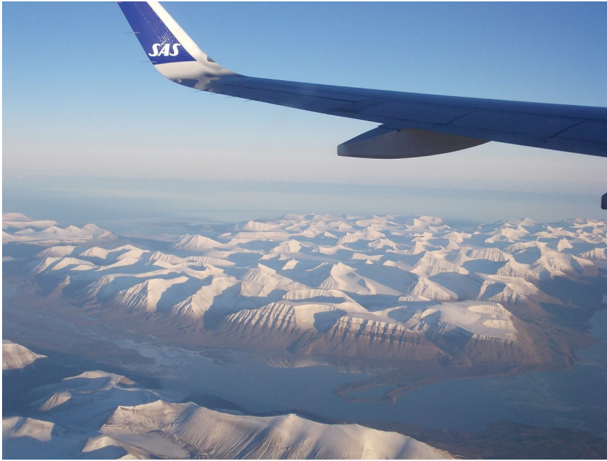
Vi forlater Svalbard

vi måtte gå til samlebandet og hente bagasjen vår, gå gjennom tollen og så sjekke inn. Det medførte en ny lang marsj, og tiden gikk. Mens vi sto i kø for å sjekke inn, kom en funksjonær og sa at han skulle sikre at flyet ble holdt igjen hvis vi kom sent til utgangen. Etter å sjekket inn, gikk vi gjennom sikkerhetskontrollen og nådde flyet akkurat i tide. Da var det godt å få sette seg i flysetet. Flyturen til Værnes ble behagelig, men så ble det spennende. Ville bagasjen komme tidsnok til at vi kunne nå flytoget? Vi sprang det vi klarte og kom til perrongen fem minutter etter togavgang, men jeg har aldri vært så glad for at et tog var syv minutter forsinket. Vi ble med, ventet få minutter på bussen, og kom hjem like før midnatt. Det eneste som manglet for å gjøre turen perfekt, var stempeling for IVV fri på Gardermoen.