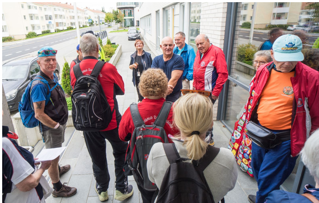
Leder Brit ønsker god tur på Ormen Lange 20,1 km

Lørdagsmorgen startet 169 deltakere på Ormen Lange-marsjen. De gikk gjennom