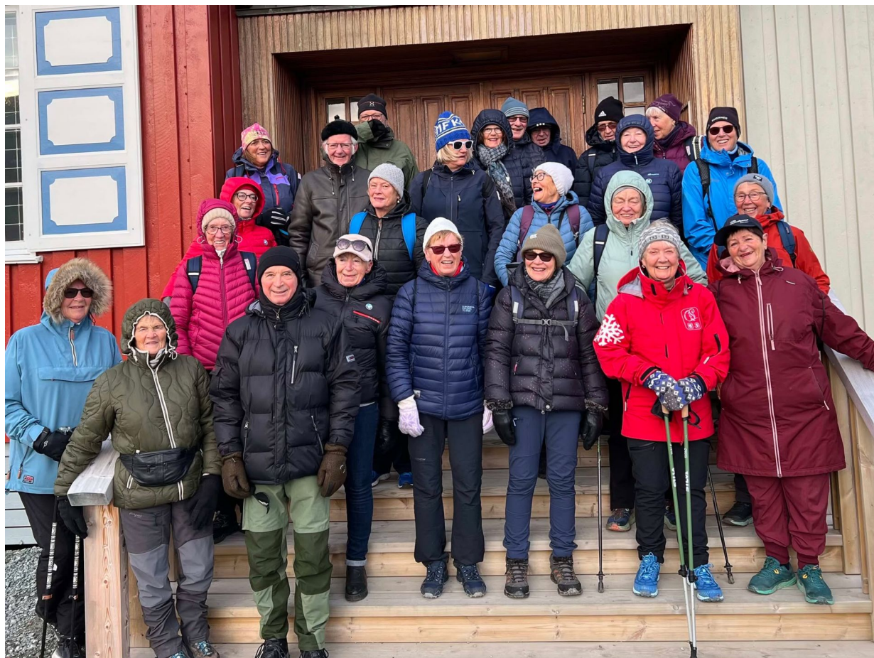
Turdeltagerne foran hotellet i Longyearbyen.

Trondheim Turmarsjforening arrangerte i september tur til Longyearbyen på Svalbard. Hovedformålet var å gå turmarsj der, men selvfølgelig gjorde vi mer enn det. Vi var jo ikke alene der. Det er omkring 2000 innbyggere i Longyearbyen, og de kommer fra 40 forskjellige nasjoner. Thailenderne og filippinere utgjør to store grupper. Det kreves ikke visum for å komme hit, og for å bo her, må man enten ha jobb eller forsørge seg selv på annen måte. De fleste innbyggere bor i senter av byen og i boligområdet som kalles «Beverly Hills».