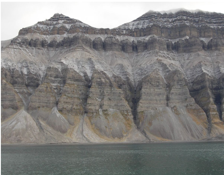
Fjellsider med uvanlig utseende

krympet brefronten nord for tungen ca 4,1 kilometer, og sør for tungen ca 3,5 kilometer. Båten gikk nær bretungen slik at vi fikk sett den skikkelig.