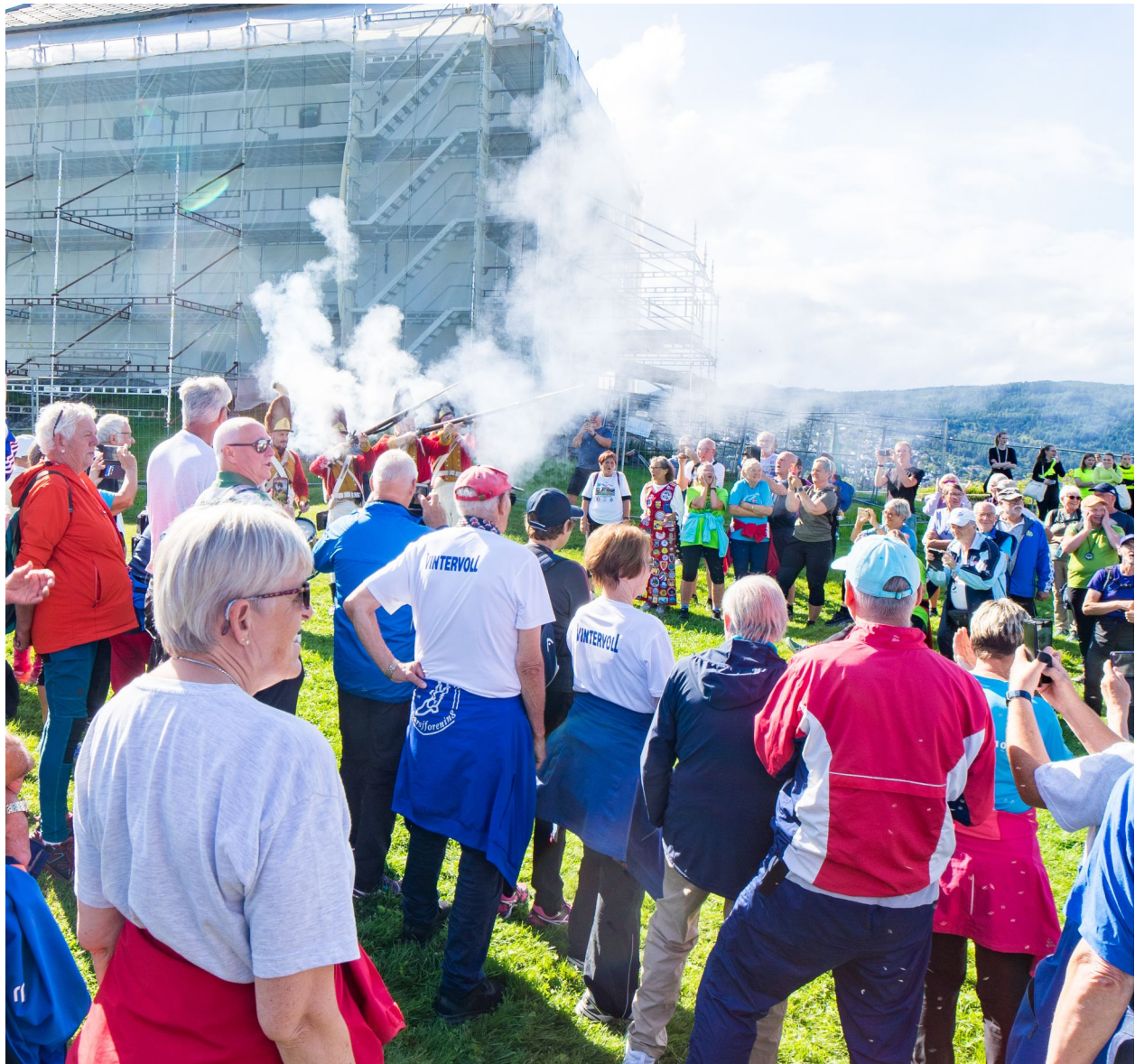
Avslutningssalutt for Norgeslekene 2014. Vell blåst!