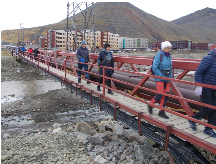
Gangbroen over Longyearbyelva