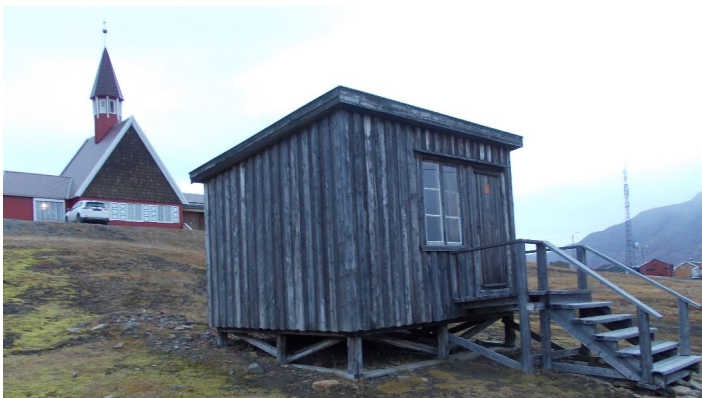
Longyearbyens eldste postkontor nedenfor verdens nordligste kirke

Nybyen ligger godt ovenfor sentrum. Den er oppført rett nedenfor gruve 2B for at de som jobbet der, skulle ha kort vei til vaske- og klesskifterom samt bolig. Lengre ned i dalen er Fenken Lodge, hvor Tom Cruse bodde da han deltok i en filmproduksjon her. Fenken var opprinnelig funksjonærmesse for ugifte av begge kjønn og ble bygget i 1947. Fra Nybyen ser man over elva til Sverdrupbyen. Der er Arbeidermessa, og like bortenfor den ligger Jomfruburet - et sted hvor det bodde bare damer. Sverdrupbyen ble anlagt ved gruve 1B i 1938 for å skaffe boliger for gruvearbeiderne. Guiden fortalte at i 1943 skjød Tirpitz og Scharnhorst gruve 2 i brann og brannen varte til 1962. Hele Longyearbyen ble satt i brann av mannskap fra en av skipene, men Sverdrupbyen unngikk det. Guiden fortalte også at da et hus i Sverdrupbyen skulle brennes, mistet de kontroll over brannen på grunn av sterk vind, og det førte til at hele bydelen brant ned. Svalbardposten fra den tiden har en annen versjon av hendelsen. Der står det at bydelen ble brent ned i en kontrollert brannøvelse i juni 1985. Guiden fortalte at det hadde det vært fem gruver med til sammen 22 mil gruveganger i området.